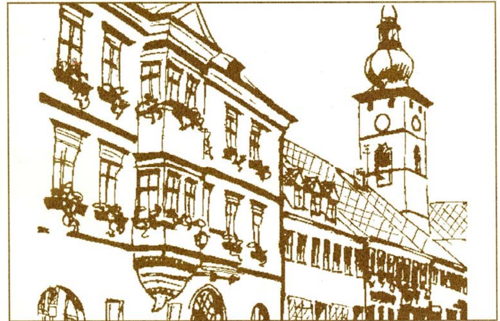
Rathaus und Stadtpfarrkirche „Marie Himmelfahrt“ Tirschenreuth

am 10. und 11. April 2010 in Tirschenreuth